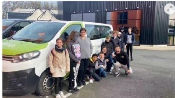
L'Europe a apporté 10 000 € pour acheter le minibus de Saint-Urbain, d'un coût de 14 000 € HT. Aujourd'hui, il sert à plusieurs associations. Par exemple, Assoli qui a emmené des jeunes à Nantes (photo) le 27 février.

Des entreprises, des associations ou des collectivités vont se partager une enveloppe d'1,4 million d'euros provenant de l'Europe. Comment cet argent est-il distribué ? Pour quoi faire ? Qui le décide ? Explications.