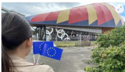
Le chapiteau en dur du Plongeur - Cité du cirque, au Mans (Sarthe) a bénéficié de près de 930 000 € de fonds européens pour sa réalisation.